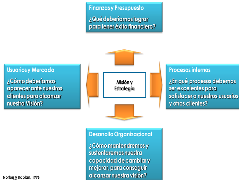
Cuadro 1 Cuadro de Mando Integral

Por otro lado, la Administración por Políticas apoya a la Alta Dirección en la identificación de las pocas estrategias vitales y en la especificación de los sistemas claves que requieren ser mejorados para lograr los objetivos estratégicos.