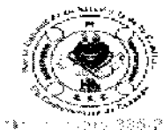
TABLA INDICE MANUAL DE CONTRATACION ESE.